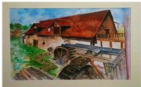
Moulin de Lapeyre

Jour 3 de l'Atelier 14 : Promenade du Boviduc : 6km au départ du Camping avec visite et dégustation à la Brasserie Artisanale de Saint Saud