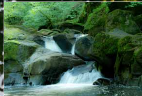
Ga je van het pad af, dan zie je stroomversnellingen

Uitzicht vanaf het park, als de avond valt