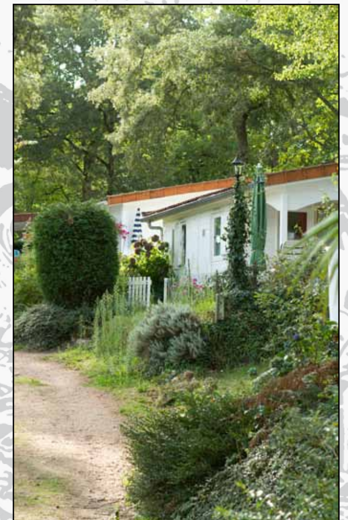
Op het park staan 22 chalets