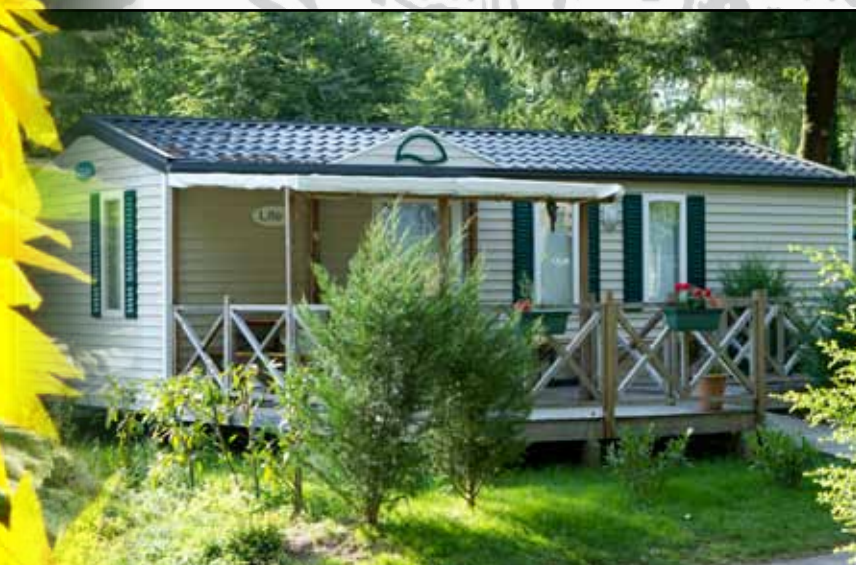
"De meeste chalets zijn te huur, al of niet via ons"