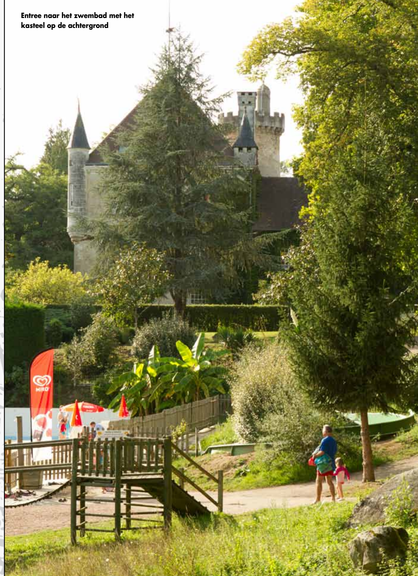
Entree naar het zwembad met het kasteel op de achtergrond