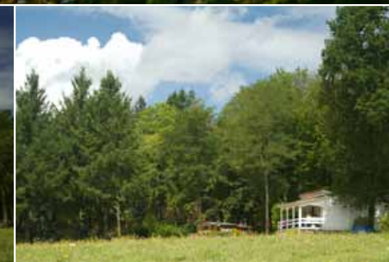
Eén van de aangepaste chalets voor rolstoelgebruikers