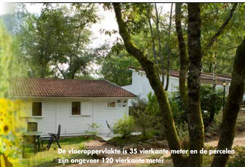
De vloeroppervlakte is 35 vierkante meter en de percelen zijn ongeveer 120 vierkante meter