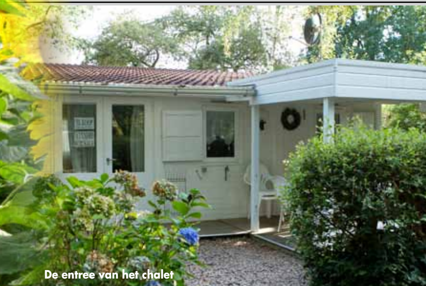
De entree van het chalet