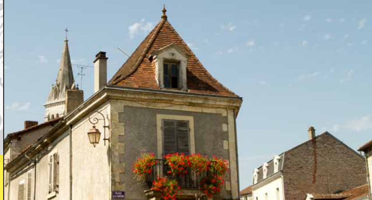
Oude Franse dorpjes en steden liggen in de buurt