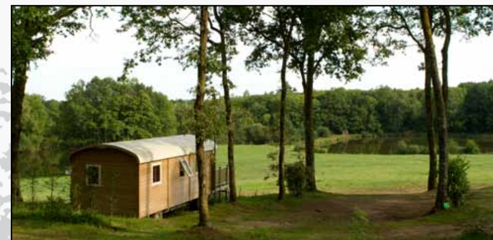
De Pipo de Clown wagens hebben een riant uitzicht

zijn stil en bieden het betere bochtenwerk. Maar ook achter de voorruit van de bolide heb je uitzicht over mooie vergezichten met een glooiend en soms rotsachtig landschap. Om de hoek liggen vaak kleine dorpjes en stadjes. Ga je van het pad af, dan zie je stroomversnellingen en donkere bossen waar je eindeloos in stilte kunt wandelen. Terug na de ochtendwandeling, moet je gauw naar de boulangerie met zijn knapperige stokbroden. Hij sluit namelijk steevast rond lunchtijd. Na deze siësta start de gemiddelde Fransman met