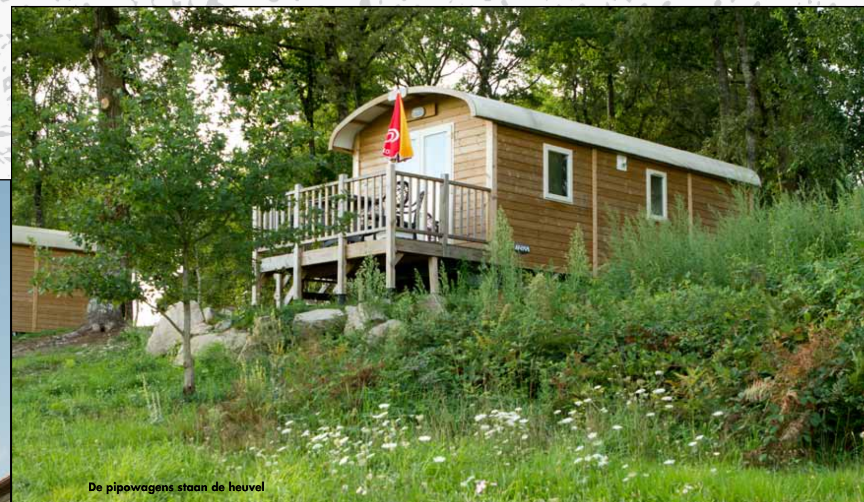
De pipowagens staan de heuvel