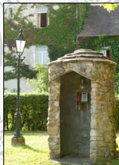
Zelfs de telefooncel is in oude stijl

ze neergezet. "Deze Roulottes of huifkarren staan op locaties met schitterend uitzicht. Zo kan men met modern comfort verblijven in een retro-accommodatie. Vanaf de veranda kijk je ver het dal in." Deze pipowagens zijn te huur, maar ook de privéchalets worden vaak te huur aangeboden. "De meeste chalets zijn te huur, al of niet via ons. Ook worden er eigenlijk constant één of twee te koop aangeboden door de eigenaren", weet zoon Floris te vertellen. De eigenaren betalen een huurprijs per jaar. Maar er is meer op het park. Ook 50 stacaravans hebben hier hun plek gevonden en voor toercaravans en kampeerders zijn meer dan honderd plekken beschikbaar. Naast de Nederlandse en Franse gasten zijn op dit park opvallend veel Britten die hier in