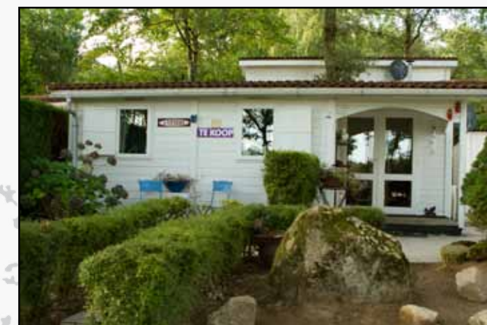
Eigenlijk worden constant één of twee chalets te koop aangeboden

zijn stil en bieden het betere bochtenwerk. Maar ook achter de voorruit van de bolide heb je uitzicht over mooie vergezichten met een glooiend en soms rotsachtig landschap. Om de hoek liggen vaak kleine dorpjes en stadjes. Ga je van het pad af, dan zie je stroomversnellingen en donkere bossen waar je eindeloos in stilte kunt wandelen. Terug na de ochtendwandeling, moet je gauw naar de boulangerie met zijn knapperige stokbroden. Hij sluit namelijk steevast rond lunchtijd. Na deze siësta start de gemiddelde Fransman met