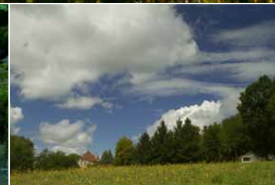
Château en chalet in één beeld gevangen