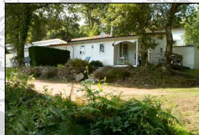
"Ervaring leert dat de Fransen mooier en beter zijn"

Op het park staan twee chalets die het eigendom zijn van de Ausems. Verder zijn er nog 20 privé-chalets met twee slaapkamers, salon en eet- en keukenhoek. De vloeroppervlakte is 35 vierkante meter en de percelen bieden ongeveer 120 vierkante meter voor de bewoners. Twee chalets zijn aangepast op rolstoelgebruikers. Aan de rand van het park - met uitzicht over grote spiegelende meren - staan sinds kort ook twee 'Pipo de Clown-wagens'. Op een toplocatie zijn