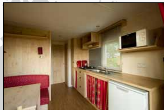
"Modern comfort in een retro-accommodatie"

ze neergezet. "Deze Roulottes of huifkarren staan op locaties met schitterend uitzicht. Zo kan men met modern comfort verblijven in een retro-accommodatie. Vanaf de veranda kijk je ver het dal in." Deze pipowagens zijn te huur, maar ook de privéchalets worden vaak te huur aangeboden. "De meeste chalets zijn te huur, al of niet via ons. Ook worden er eigenlijk constant één of twee te koop aangeboden door de eigenaren", weet zoon Floris te vertellen. De eigenaren betalen een huurprijs per jaar. Maar er is meer op het park. Ook 50 stacaravans hebben hier hun plek gevonden en voor toercaravans en kampeerders zijn meer dan honderd plekken beschikbaar. Naast de Nederlandse en Franse gasten zijn op dit park opvallend veel Britten die hier in