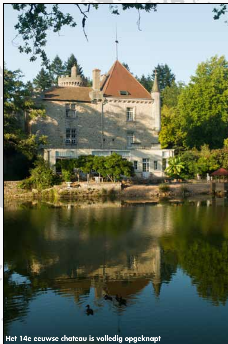
Het 14e eeuwse chateau is volledig opgeknapt

Dat deze streek erg aantrekkelijk is, klopt als een bus. Dat geldt natuurlijk voor de motorrijders, want de wegen